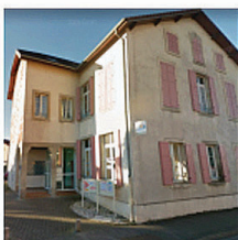
(face à l'OPH)